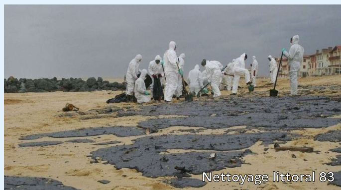
Nettoyage littoral 83