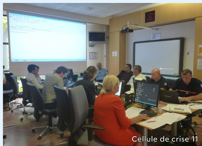
Cellule de crise 11