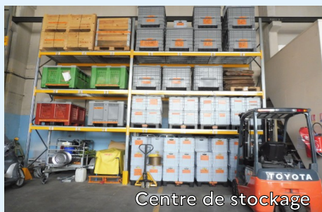
Centre de stockage